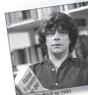
Boudewijn Büch in 1985

Een nieuwbouwwijk langs het spoor in Leidsche Rijn. Hier zijn de resultaten van mijn wetenschappelijk onderzoek: er is in deze straat bij tien huizen aangebeeld, op twee adressen was niemand thuis. In drie panden wonen mensen die geen Nederlands spreken en geen idee hebben over wie ik ze iets vraag. Van de vijf overigen denkt een-tje dat Boudewijn Büch een bekende Utrechter was. Vier kennen hem wel: van tv. Geen van de respondenten antwoordt dat het om een auteur gaat. Dus hoewel deze straat in de Schrijversbuurt ligt, past hij in onze rubriek van omroepcoryfeeën.