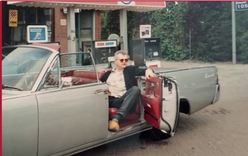
Vlnr: In Oldeborn: de Lincoln bij een tankstation ontlokte weer een mooie program-mabijdrage.